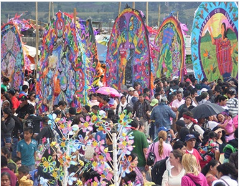
Festival de Barriletes Gigantes celebrado el 1 de noviembre de 2014 en Sumpango, poblado del departamento de Sacatepéquez.