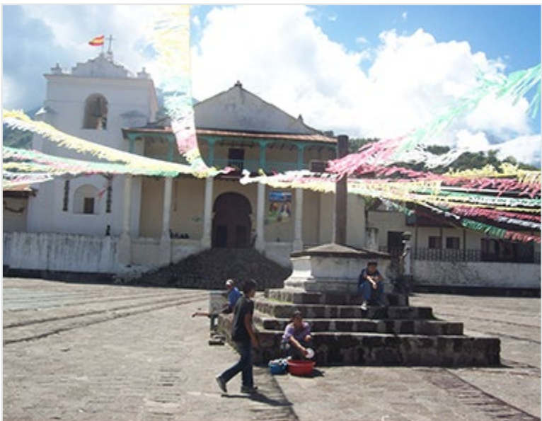
Niños «matan el tiempo» alrededor de la cruz de piedra enclavada en el atrio de la iglesia Santiago Apóstol de Atitlán, una de las edificaciones coloniales más antiguas de Guatemala.