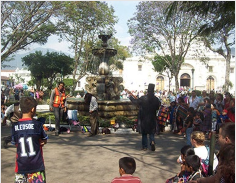
Diversas actividades culturales celebran los artistas alrededor de la Fuente de las Sirenas en el Parque Central de La Antigua.